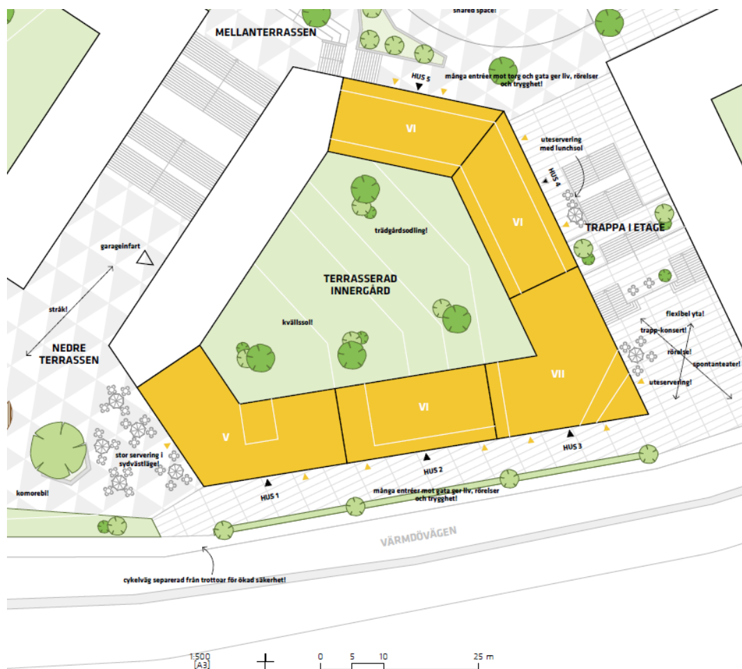
Figur 1.1. Situationsplan över kv. Brytaren mindre.

Utredningen avgränsar sig till att enbart behandla innergården på kv. Brytaren mindre samt taktytor från omringande huskroppar.